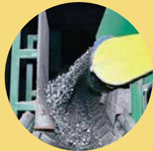
Transformation en pellets industriels à haut pouvoir calorifique (HPC)