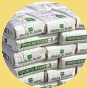
Résidus minéraux pour le ciment