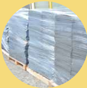
Dalles et moquettes en lès usagées